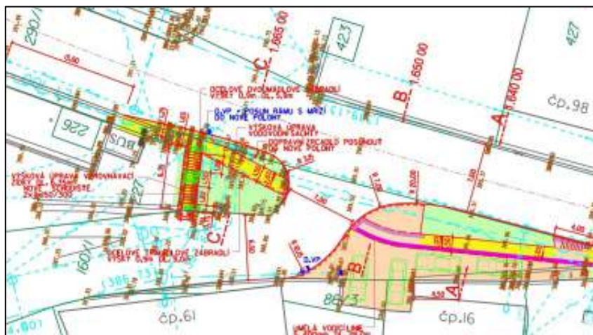
Situace řešení křižovatky u hostince

Křižovatka u hostince má velmi rozšířenou napojovací větev místní komunikace a její napojení není kolmé, ale šikmé. Pro řidiče i chodce je místo nepřehledné a nebezpečné. Nynější chodník končí u zastávky. Chodec, který chce od zastávky pokračovat ve směru ke křižovatce a dál, musí jít kus cesty po krajnici silnice a potom při přecházení komunikace překonat velkou vzdálenost. Navržená úprava vytváří kolmé napojení místní komunikace na silnici, zužuje tuto komunikaci a prodlužuje chodník u zastávky až ke stávajícímu chodníku u silnice za křižovatkou. Stávající schodiště u zastávky bude upraveno, aby stupně nezasahovaly do chodníku.