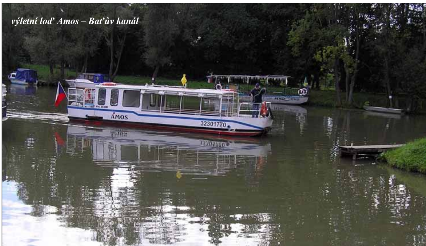
výletní loď Amos – Baťův kanál

Upozornění: Kdo nechce být uváděn ve společenské rubrice, nahlaste svůj nesouhlas na obecním úřadě.